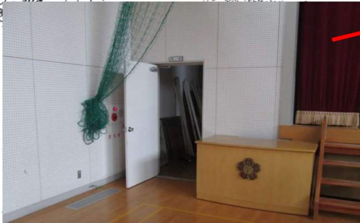
ここに体育館の電気をつけるプレイカーがあるので、ここまでの通路は確保しておくこと。